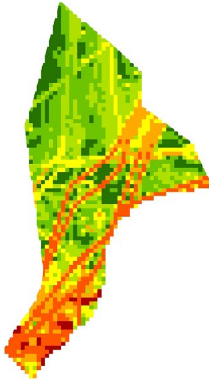
Verdeling Wet Surface Area varende/stilliggende zeeschepen per gridcel van 5x5 kilometer (NCP). Hoe roder de kleur, hoe hoger de toegekende emissie.